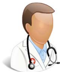
Figura nr.1.1. Descifrarea subiecților primirii remunerațiilor ilicite pentru îndeplinirea lucrărilor legate de deservirea populației, reieșind din episoadele cercetare în sentințele judecătorești

Număr inculpați: 3 persoane ; Număr episoade: 25 ; Vârsta medie: 56 ani ; Domeniul de activitate: cadre medicale ; Primesc remunerații ilicite pentru prestarea serviciilor medicale.