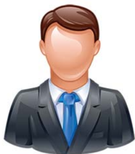
Figura nr.1.3. Descifrarea subiecților implicați în cazuri de luare de mită

Din motivul depersonalizării sentinței, studiul nu a identificat date detaliate în privința profilului infractorului implicat în luare de mită.